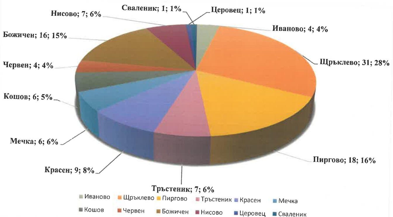
Диаграма № 3. Издадени разрешения за строеж по населени места

Разпределено по населени места, извършеното строителство е с най-голям в селата Щръклево – 31 бр. или 28 %, Пиргово – 18 бр. или 16%, Божичен – 16 бр. или 15 % и т.н. (Диаграма № 3).