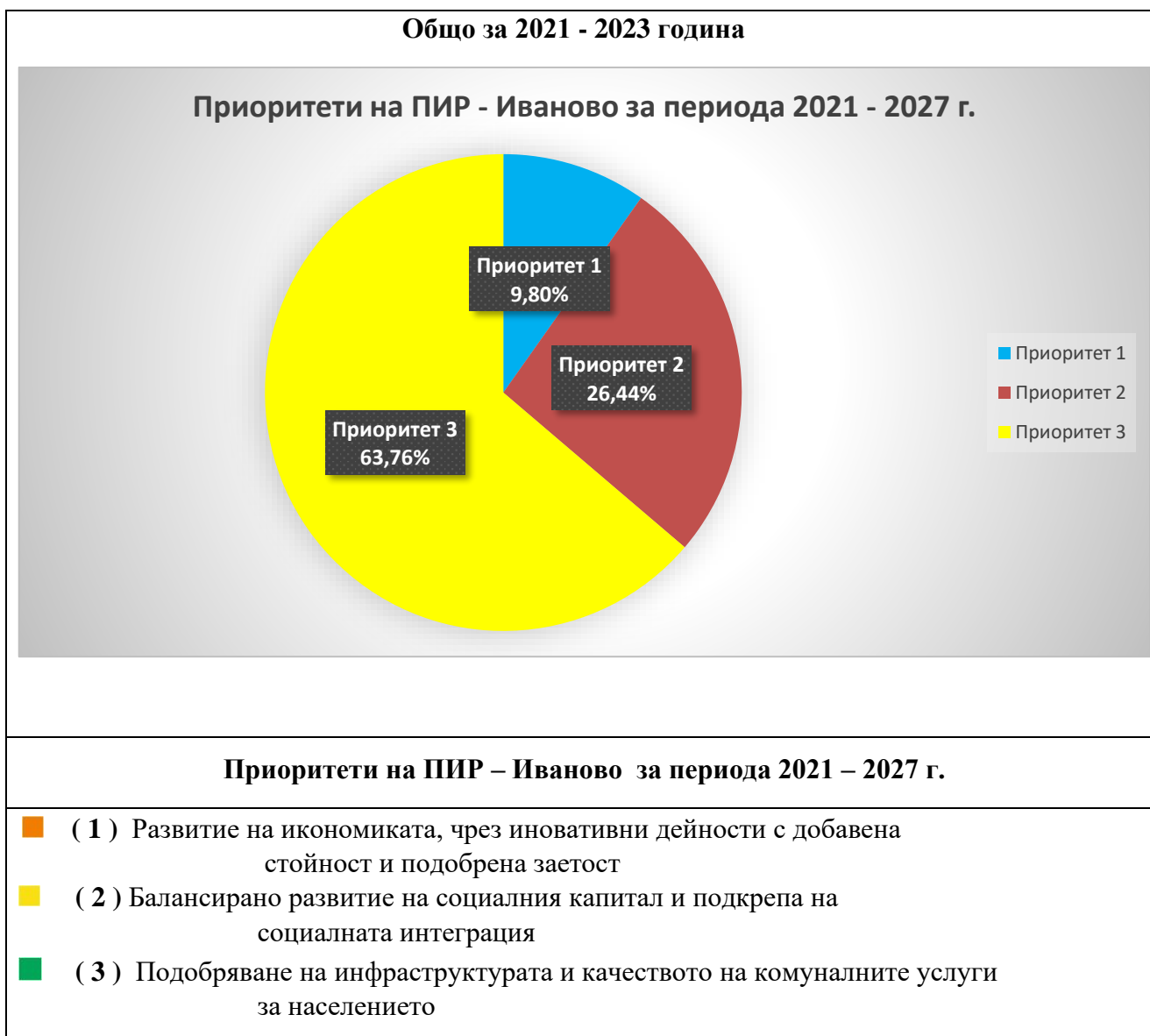
Фигура 3. Принос на приоритетите (%) към изпълнението по разходи на ПИР