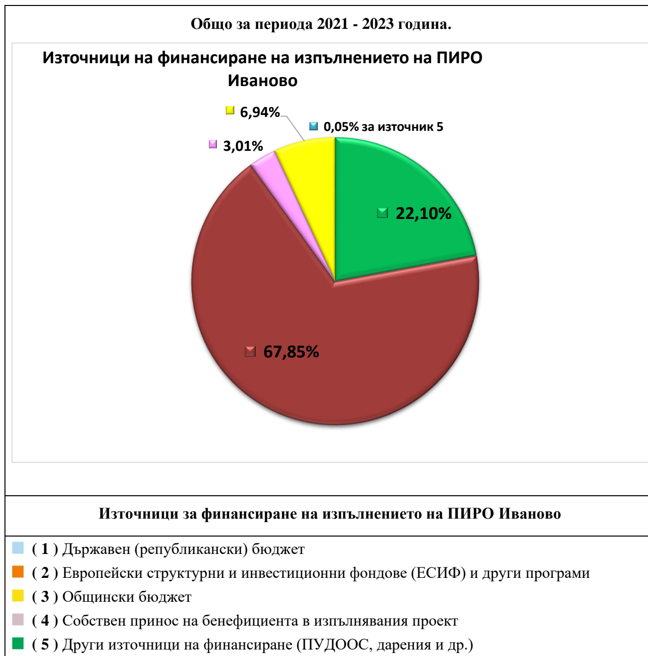
Фигура 4. Разпределение на реално изплатените средства за проекти в ПИРО – Иваново според относителния дял ( %) на източника на финансиране