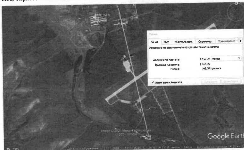
Фигура №5 Местоположение на имота до най-близко разположените обекти, подлежащи на здравна защита – жилищни сгради в село Щръклево.

На фигура №5 по-долу е представено местоположението на имота, в който ще се реализира ИП, спрямо най-близките къщи на населеното място.