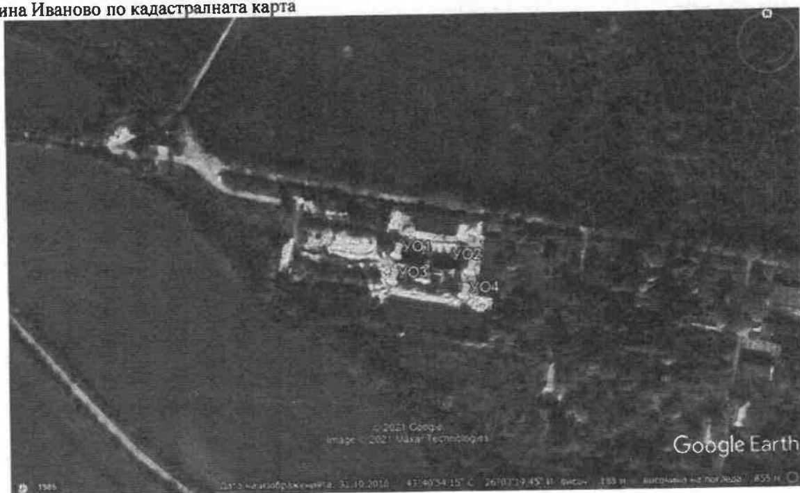
Фигура №3 Местоположение на ПИ 84049.166.369, местност „Дренето“, землище на с. Щръклево, община Иваново

Със Заповед №РД-09-118 от 05.04.2017 г. на кмета на Община Иваново е одобрен ПУП-ПЗ за десет броя поземлени имота в местността „Дренето“, землище на с. Щръклево, община Иваново, един от които е ПИ 000369 (предмет на настоящото инвестиционно предложение). С одобряването на ПУП-ПЗ предназначението на ПИ 000369 (стар идентификатор, настоящ нов идентификатор 84049.166.369) е променено от „Друг нестопански терен“ в „Смесено обществено обслужващо и производствено складово предназначение“.