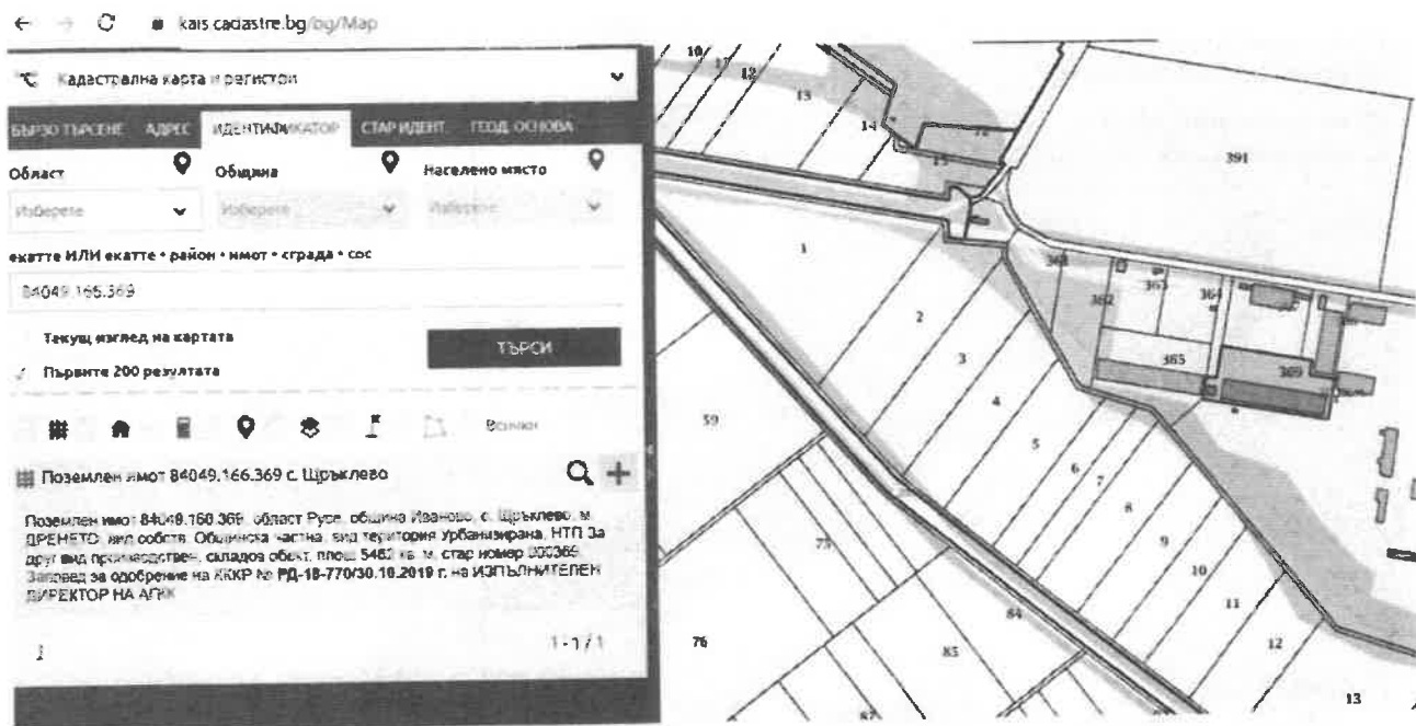
Фигура №2 Местоположение на ПИ 84049.166.369, местност „Дренето“, землище на с. Щръклево, община Иваново по кадастралната карта